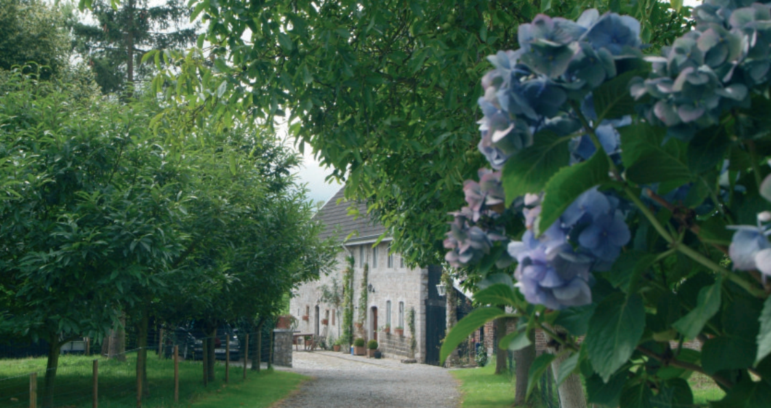
Het gehucht Steenteveld